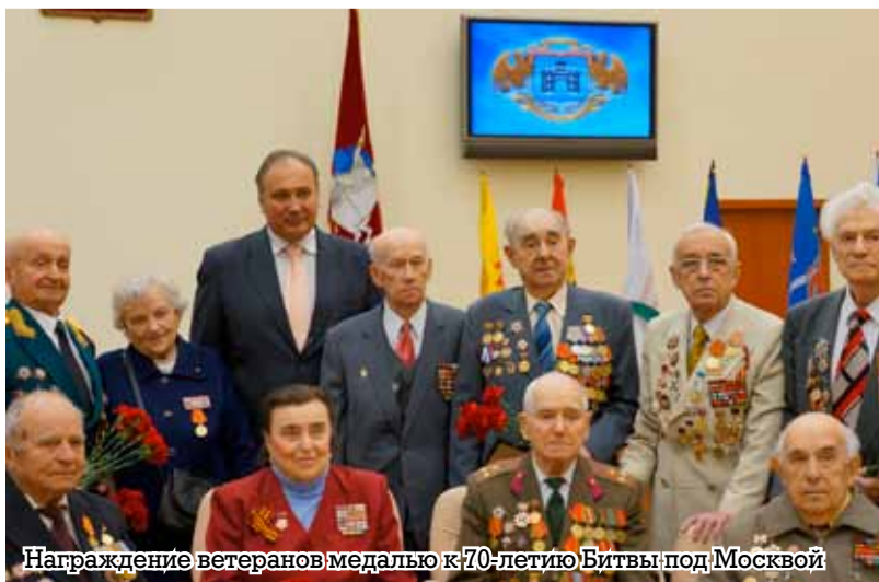
Награждение ветеранов медалью к 70-летию Битвы под Москвой

— Нормально все сложилось. Когда муж демобилизовался, я приехала к нему в Москву. Он начал преподавать в музыкальной школе. Я тоже устроилась на работу, сына устроили в ясли, ясли тогда были переполнены, но помог друг свекра, и я туда же устроилась воспитателем, хотела пойти на телеграф, но из-за ребенка осталась воспитателем. Поступила в институт, в Ленинский педагогический, выучилась. Так и работала, не учителем физкультуры, но воспитателем. Потом была инспектором РОНО, депутатом меня выбрали, много всего. Звания давали «Почетный ветеран», «Почетный житель района» и другие.