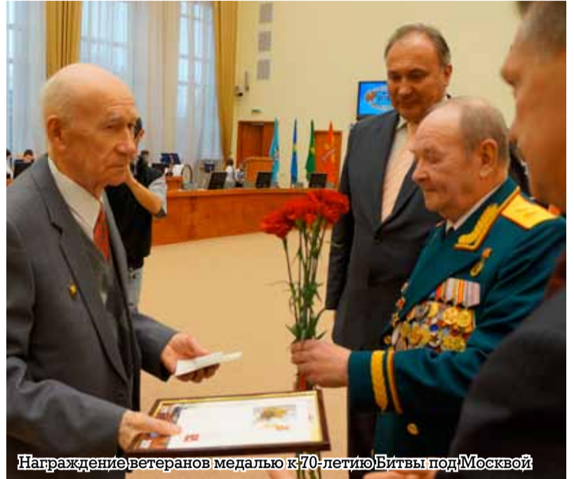
Награждение ветеранов медалью к 70-летию Битвы под Москвой

Битва под Москвой — первое поражение Гитлера, поэтому она так важна.