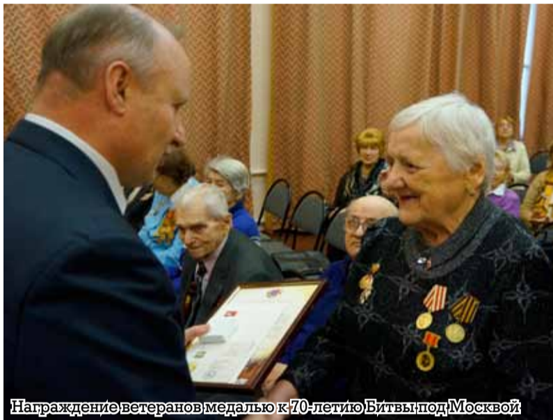
Награждение ветеранов медалью к 70-летию Битвы под Москвой

— Ой! Много, 26. И ордена Отечественной войны, и медали за боевые заслуги и так далее. Награды давали не только за что-то конкретное, но и за добросовестную службу в течение какого-то длительного времени. Я считаю, что сам факт пребывания на фронте — это уже